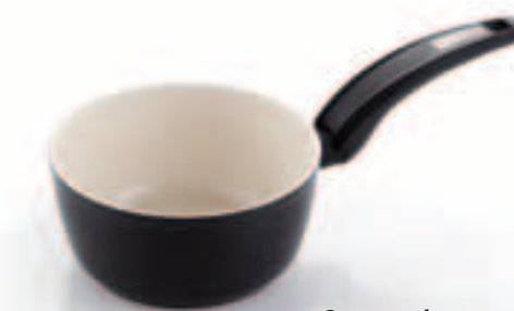
Casseruola 1 manico Saucepan

cm. ø 20 0002720120 cm. ø 22 0002720122 cm. ø 24 0002720124 cm. ø 26 0002720126 cm. ø 28 0002720128 cm. ø 30 0002720130