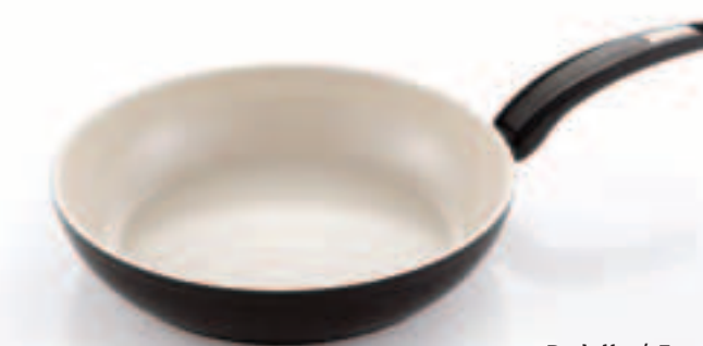
Padella / Frypan

cm. ø 20 0002720120 cm. ø 22 0002720122 cm. ø 24 0002720124 cm. ø 26 0002720126 cm. ø 28 0002720128 cm. ø 30 0002720130