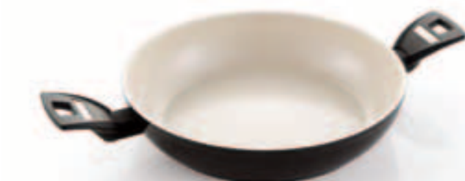
Tegame 2 maniglie 2 handle skillet