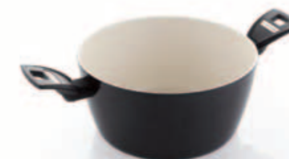
Casseruola 2 maniglie Dutch oven