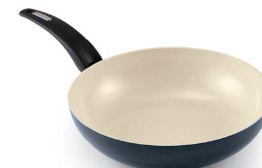
Wok / Wok (1 handle)