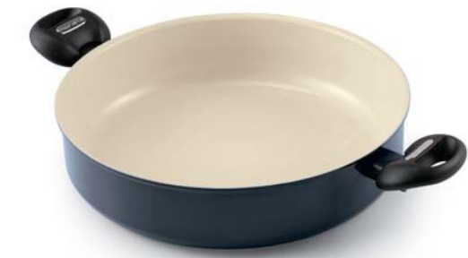
Tegame 2 maniglie 2 handle skillet