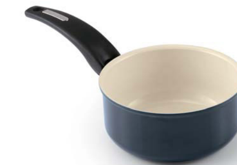
Casseruola 1 manico Saucepan