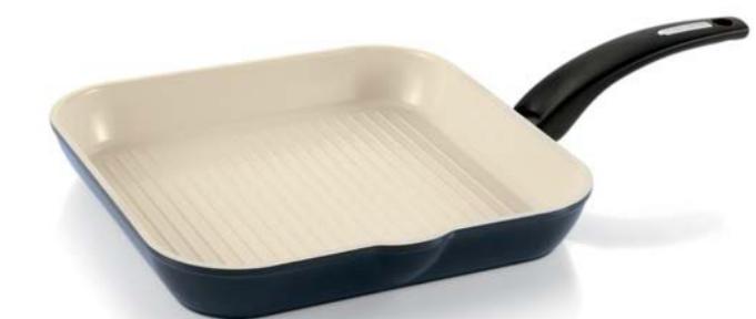
Bistecchiera / Grill Pan