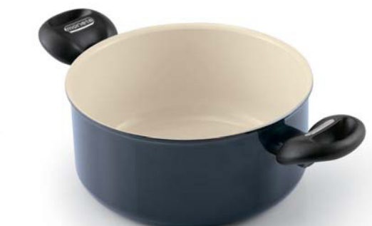
Casseruola 2 maniglie Dutch oven