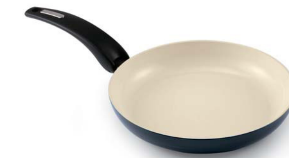
Padella / Frypan